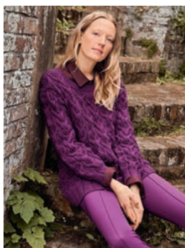
3 Ninja ** C. 10