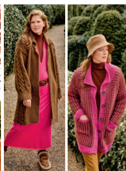
21 Nanni ** C. 25