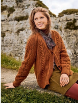
30 Nanetta ** C. 65