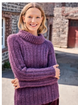
5 Nolda ** C. 12