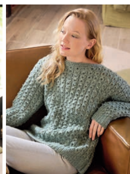
12 Noreena ** C. 17