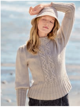
35 Nela ** C. 69