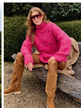
17 Nadinka ** C. 21