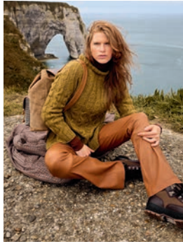
31 Notburgis *** C. 66