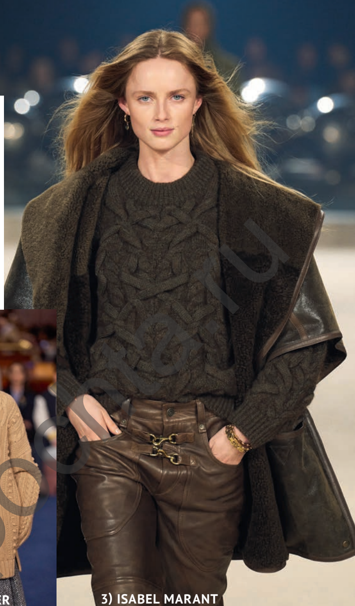
3) ISABEL MARANT

В прохладные дни ключевую роль в нашем гардеробе начинают играть пуловеры, и неудивительно, что при этом они приобретают весьма впечатляющий вид. Взгляните, например, на коллекции ведущих мировых дизайнеров, представленные на неделях моды от Парижа и Милана до заокеанского Нью-Йорка. Фантазийные «косы», переплетения в виде ромбов, декоративные «шишечки» придают моделям динамичность и экспрессию. В игру вступают не только узоры, но и удобные силуэты оверсайз с воротниками свободной формы. Ощущение уюта – еще одна важная составляющая осенних образов, которые излучают утонченную женственность, неподвластную времени.