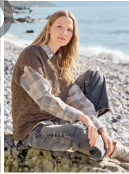
38 Nike *** C. 72