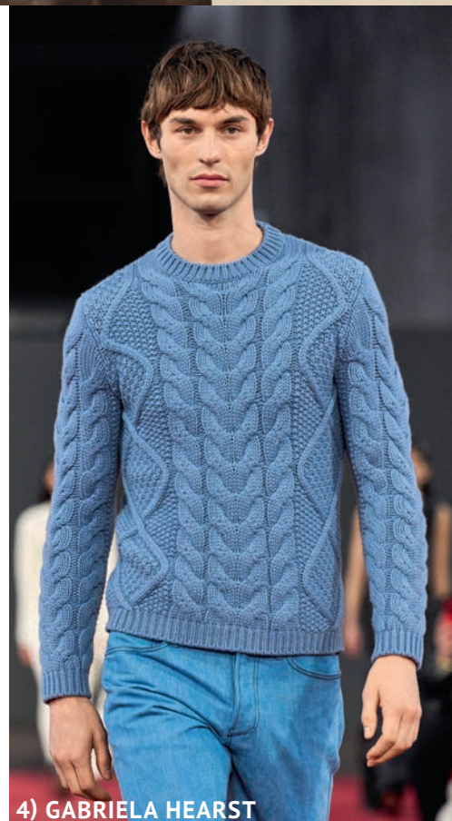
4) GABRIELA HEARST