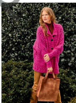
18 Normana *** C. 22