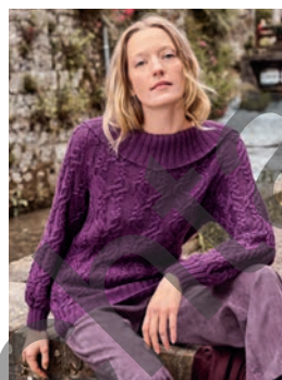
6 Netti ** C. 12