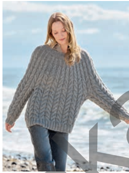
36 Nilla *** C. 70