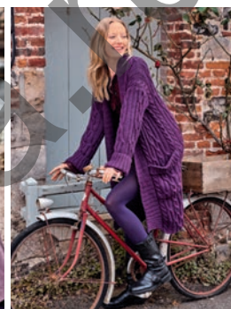
7 Ninka ** C. 13