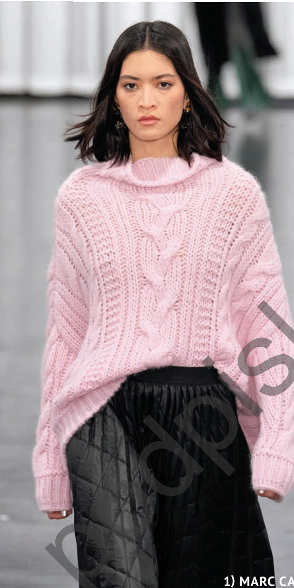
1) MARC CAIN