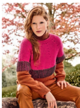
20 Natalie ** C. 24