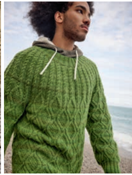
48 Narziß *** C. 81