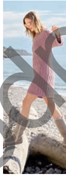
41 Nonara *** C. 74