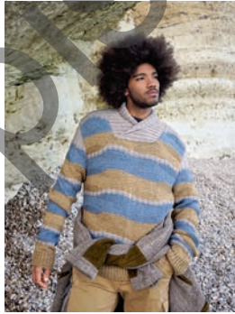
42 Nollo *** C. 76