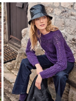
2 Neli *** C. 9