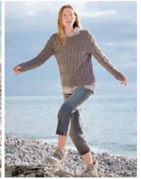
39 Nörte ** C. 73