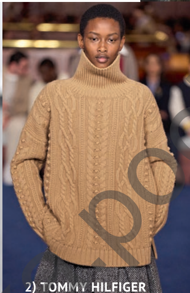
2) TOMMY HILFIGER