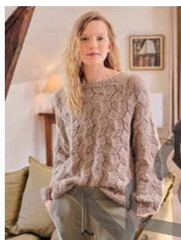
9 Notburga ** C. 15