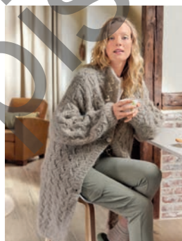
14 Norgard ** C. 19