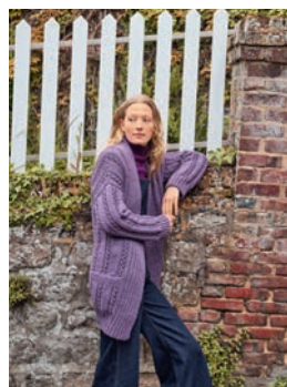
1 Natta *** C. 8