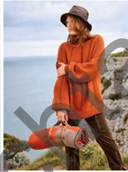
33 Nael ** C. 67