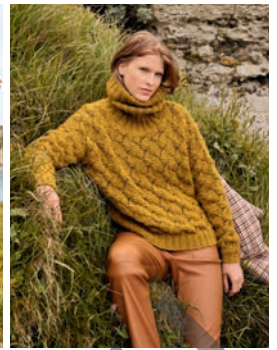
29 Nan ** C. 64