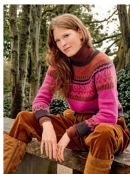
19 Nancy *** C. 23