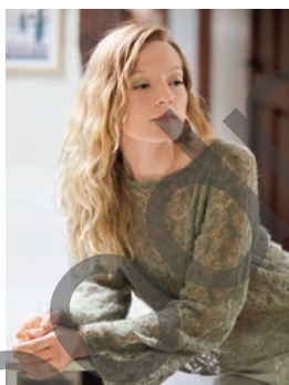
13 Nannon ** C. 18