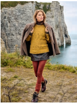
24 Nada *** C. 60